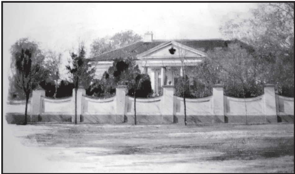
2. Стари каштел, Велико Средиште

Укратко само о дворцима или каштелима и о њиховом некадашњем изгледу. Стари дворац је изграђен у класицистичком стилу, (Слика бр.2) што значи, угледање на грађевинска дела из класичне старине. Сличне дворце у то време градили су у други