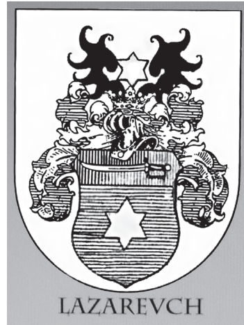
1. Грб породице Лазаревић