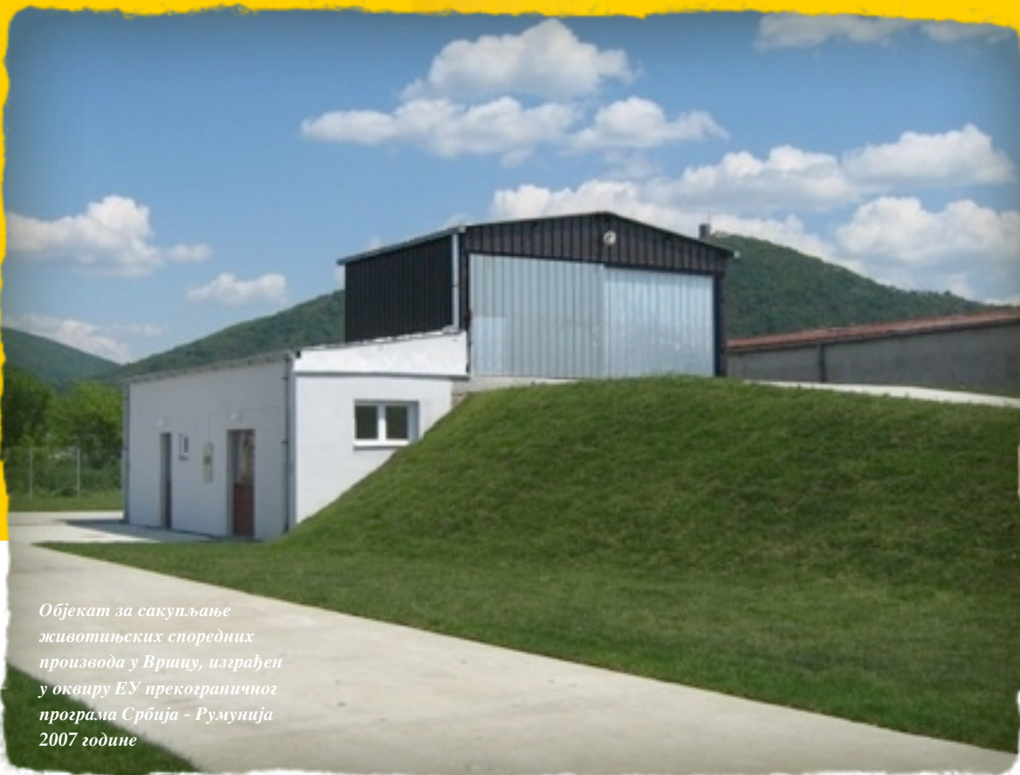
Објекат за сакупљање животињских споредних производа у Вршцу, изграђен у оквиру ЕУ прекограничног програма Србија - Румунија 2007 године