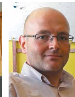
Žika Reh, sekretar Sekretarijata za poljoprivredu i zaštitu životne sredine