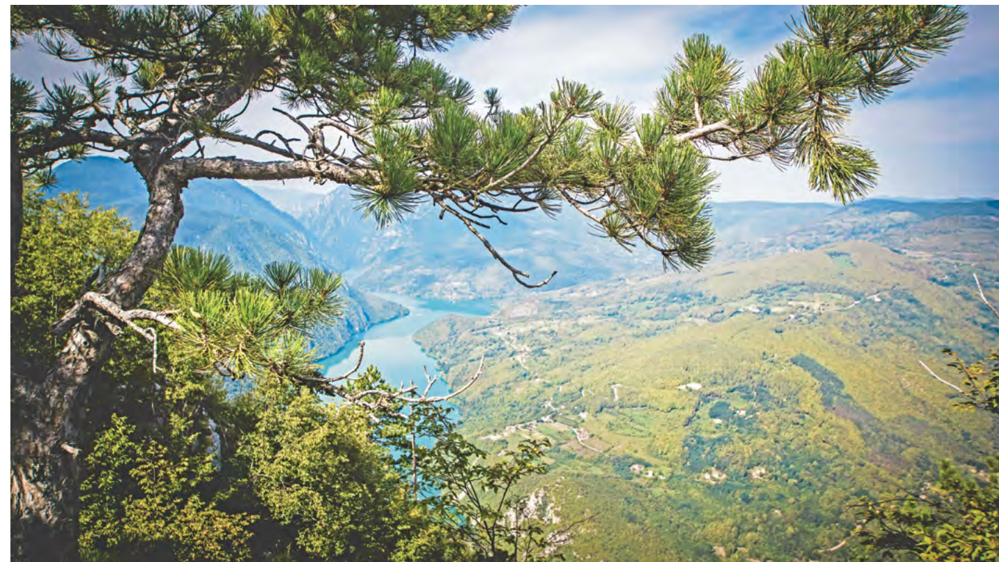
Banjska stena na Tari jedan od najpoznatijih i najlepših vidikovaca u Srbiji.

sti išlo u prilog, jer sada ni ono što je dobro urađeno građani ne vide. Zato je trenutno jedan od važnijih ciljeva udruženja građana da se izbore za javno objavljivanje na sajtovima oba zavoda za zaštitu prirode, ili na sajtu Ministarstva, svih dokumenata u vezi zaštite prirode, za sva područja u Srbiji.